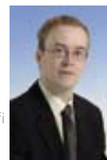
Jorma Rähä Kaivopalvelut

030 600 2214 fax 030 600 2211 johanna.evilehto@pipelife.fi