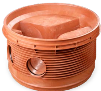
Studzienka PRO 1000

Mogą Państwo wybrać także studzienkę PRO 1000 lub PRO 800 ze zwieńczeniem teleskopowym PP 630 mm. W takim przypadku istnieje możliwość wykonania płynnej regulacji wysokości zwieńczenia studni.