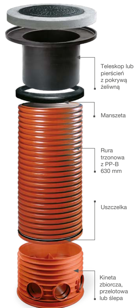
Studnia PRO 630